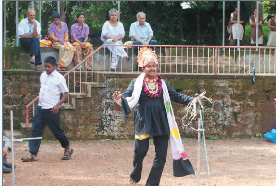
Street Play on Tobacco & Cancer