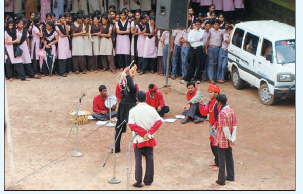
ಜೇಡಿ ನಾಟಕ : ಹೊಗೆಸೊಪ್ಪು ಹಾಗೂ ಕ್ಯಾನ್ಸರ್